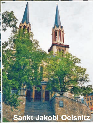
Sankt Jakobi Oelsnitz